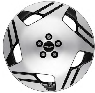
19" Leichtmetallfelgen Hyper Silver A-Type Electrified G80 & Premium