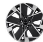
Cerchi in lega da 19" Grigio scuro opaco Pure/Premium