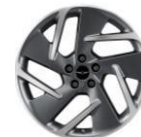
Cerchi in lega da 20" Argento chiaro Optional Premium