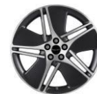
Cerchi in lega da 21" Grigio scuro metallizzato lucido Luxury