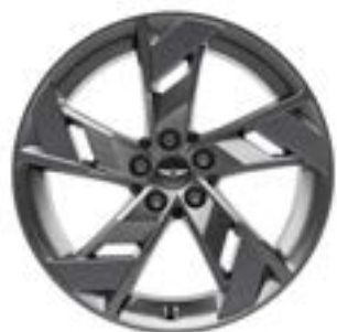
20" Leichtmetallfelgen Dark Sputtering Sport