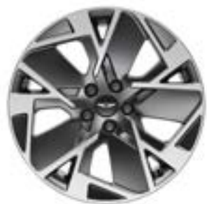
19" Leichtmetallfelgen Front Machined Sport